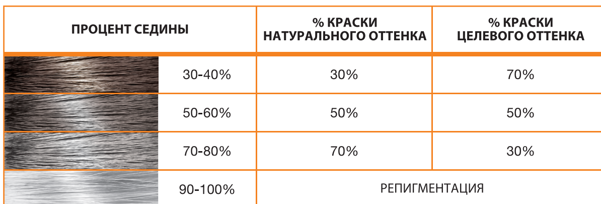
Таблица № 2

РЕПИГМЕНТАЦИЯ - это введение искусственных пигментов внутрь волоса с целью выравнивания впитываемости по всей его поверхности. Репигментация обеспечивает равномерность окрашивания по всей длине и сохранение полученного цвета волос в течении длительного времени.